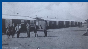
't Wijde Gat