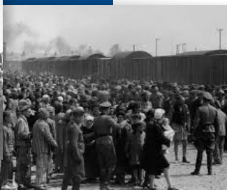
Aankomst Auschwitz-Birkenau 1944