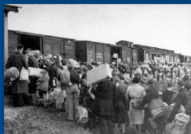
Transport Westerbork - Auschwitz