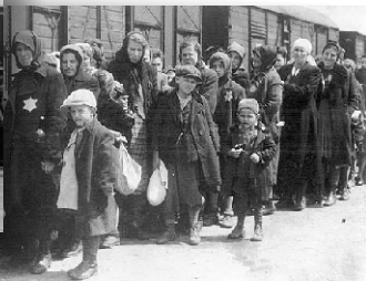
Op weg naar de selectie